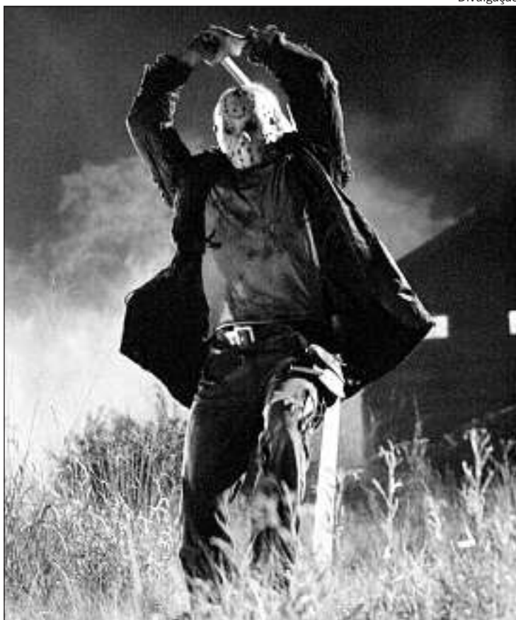
JASON VORHEES ataca: o menino morto em Crystal Lake vive e mata

Moralismos à parte (isso está entranhado na cultura americana e em quase todo tipo de filme de Hollywood há décadas), é o tipo de filme para quem gosta do gênero e que andava meio sumido das telas, repletas de adaptações de filmes de terror psicológico orientais, com muito clima e poucas cenas radicais de fato. Puro escapismo inconsequente. O facão voltou e está cortando como nunca. Slash! ■